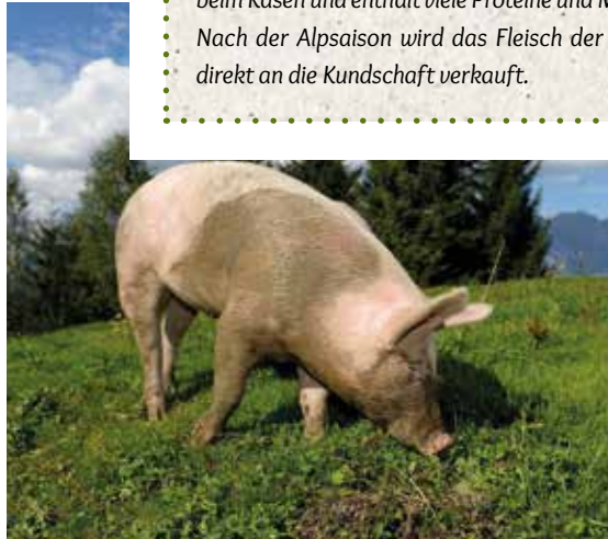
Ein Alpschwein beim Umzug vom Unter- zum Mittelstafel.

Auf der Alp Guetbächi leben 15 Schweine. Sie werden während der Alpzeit neben etwas Getreide vor allem mit der Schotte gefüttert. Diese entsteht als «Abfallprodukt» beim Käsen und enthält viele Proteine und Mineralstoffe. Nach der Alpsaison wird das Fleisch der Alpschweine direkt an die Kundschaft verkauft.